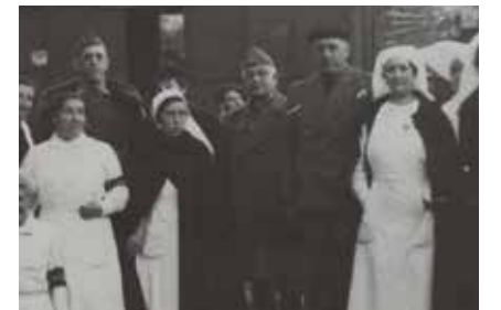
LUIS MARTÍN PINILLOS (centro) visita el campo de Irún, 1938.

En este tema ha habido mucha confusión y he intentado poner un poco de orden. Para empezar, los prisioneros de los campos y de los batallones de trabajadores no