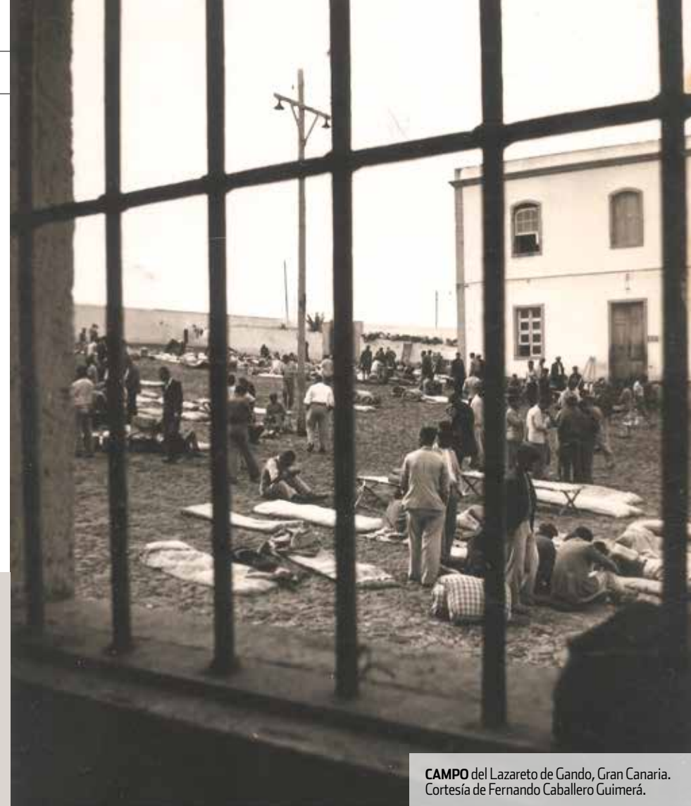
CAMPO del Lazareto de Gando, Gran Canaria.

Franco tenía unas necesidades, unos objetivos y una situación diferentes a los de Hitler o Stalin, por eso el suyo es un sistema diferente. La reeducación cristiana era muy importante, lo que no ocurría en la Alemania de Hitler. Aquí no había cámaras de gas, es cierto, pero se asesinaba de otra