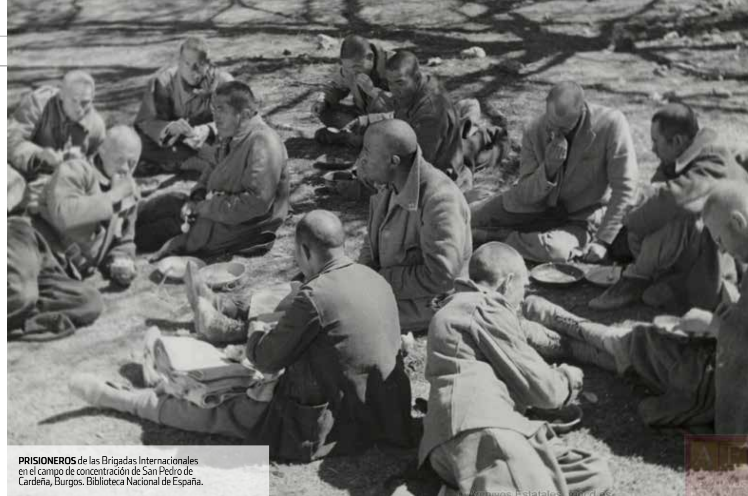
PRISIONEROS de las Brigadas Internacionales en el campo de concentración de San Pedro de Cardeña, Burgos.

Es el que más se ha investigado por su duración y, también, porque es el que más extranjeros tuvo. Cuando los brigadistas presos regresaron a sus países, enseguida divulgaron la crudeza del campo. El de Miranda de Ebro fue muy importante, pero que hablemos tanto de él tiene mucho que ver con el borrado de la memoria en nuestro país. Era más difícil difundir lo que ocurría en el de San Marcos (León) o el de Castuera (Badajoz), porque los presos liberados salían amedrentados. Miranda es el más célebre, pero después de mi investigación creo que no fue el más importante, al menos en cuanto a dureza y crueldad. Por el número de víctimas y por sus testimonios, el más terrible fue el de San Marcos.